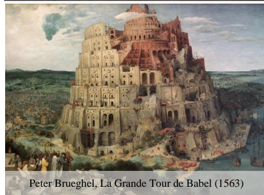
Peter Brueghel, La Grande Tour de Babel (1563)